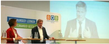
BUNDES ÖKONOMISCHE BILDUNG DEUTSCHLAND BÖB-KONGRESS 2022 Bundeswirtschaftsminister Dr. Habeck beim BÖB-Jahreskongress 2022

„Ohne das grundlegende wirtschaftliche Verständnis wird es kaum oder gar nicht möglich sein, einen fundierten Meinungsbildungsprozess zu durchlaufen.“